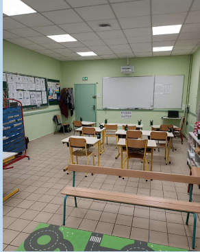
RÉFECTION SALLE DE CLASSE DU CP