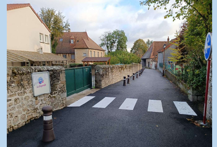
SECURISATION BOULEVARD DE LA VILLE