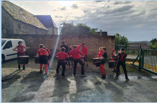
JUIN : FÊTE DE LA MUSIQUE