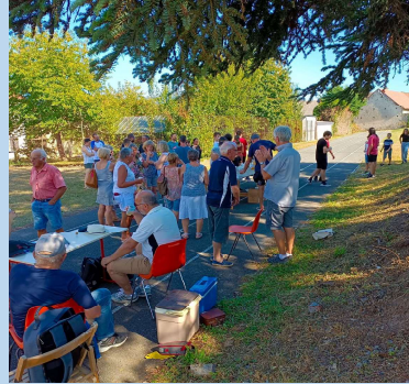
SEPTEMBRE : FORUM DES ASSOCIATIONS