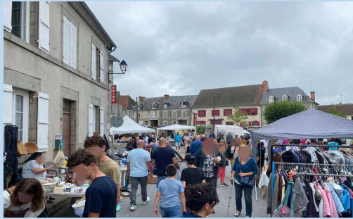
AOÛT : BROCANTE